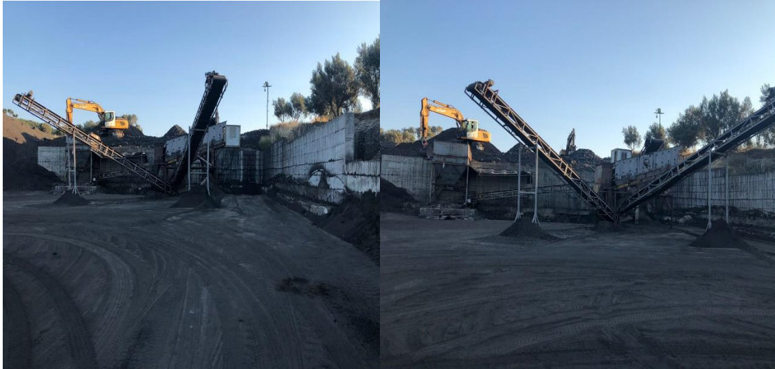
FOTO TE AKTIVITETIT