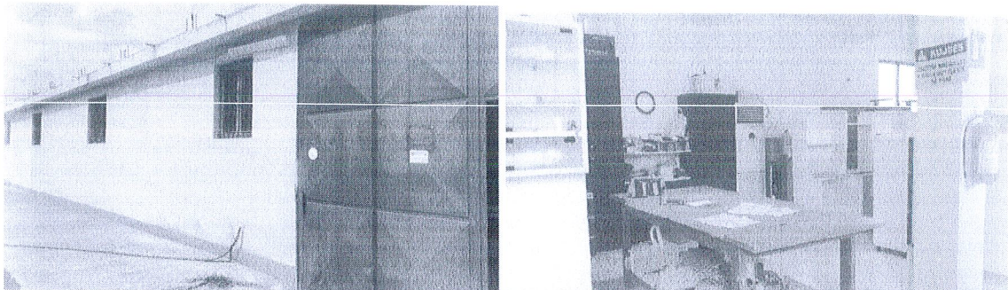
Pamje nga objekti që do ku zhvillohet e aktivitetit.