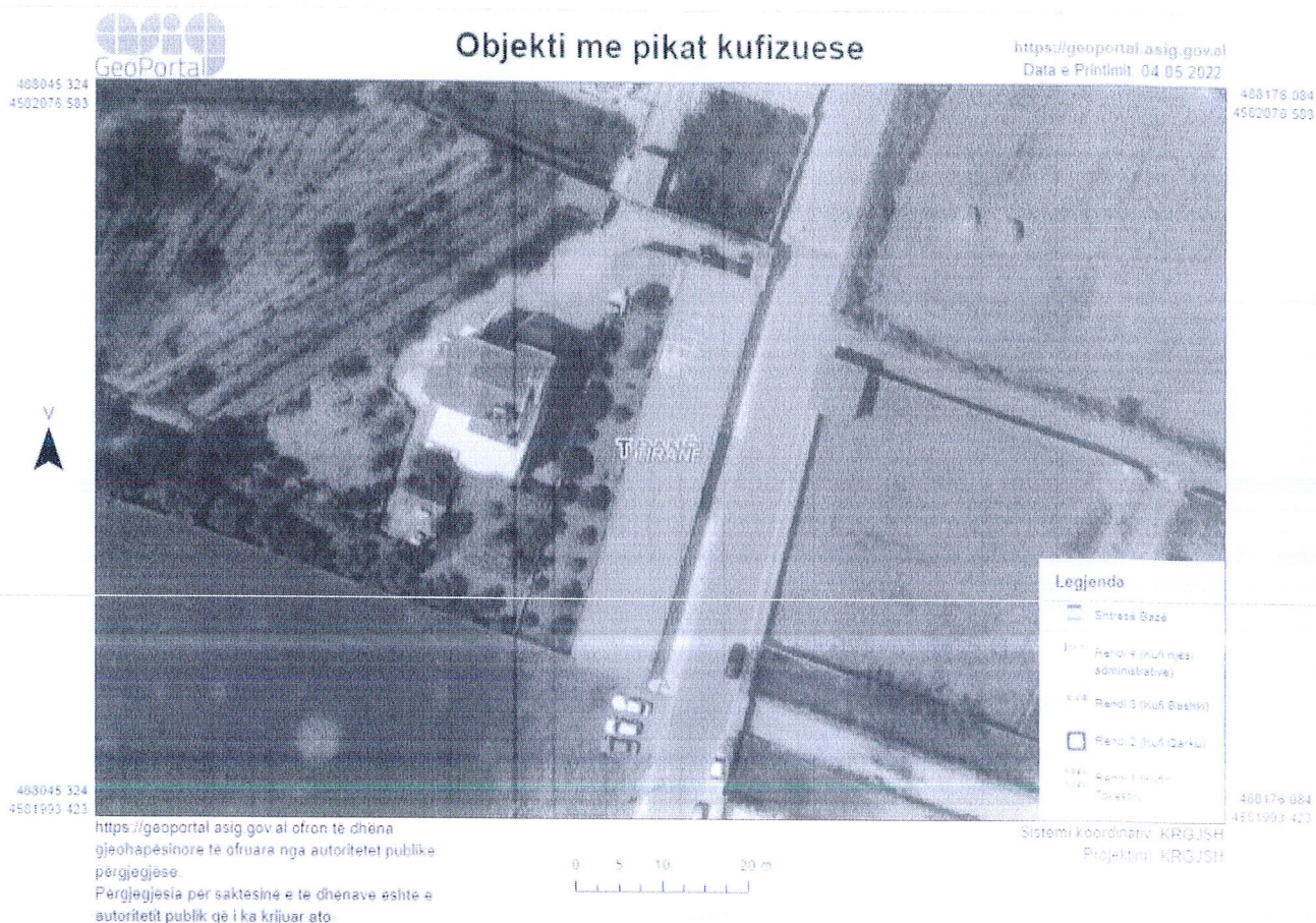
Fig.1. Ortofoto e vendndodhjes së veprimtarisë (Sipas sistemit koordinativ- Albanian 1986/Gauss-Kruger Zone ).

Objekti ku do zhvillohet aktiviteti në fjalë ndodhet në brendësi të pronës dhe nuk cenon pronat e tjera përreth. Zona e vendndodhjes së objektit ka infrastrukturë ekzistuese rrugore, rrjetin elektrik dhe rrjetin e furnizimit me ujë të pijshëm.