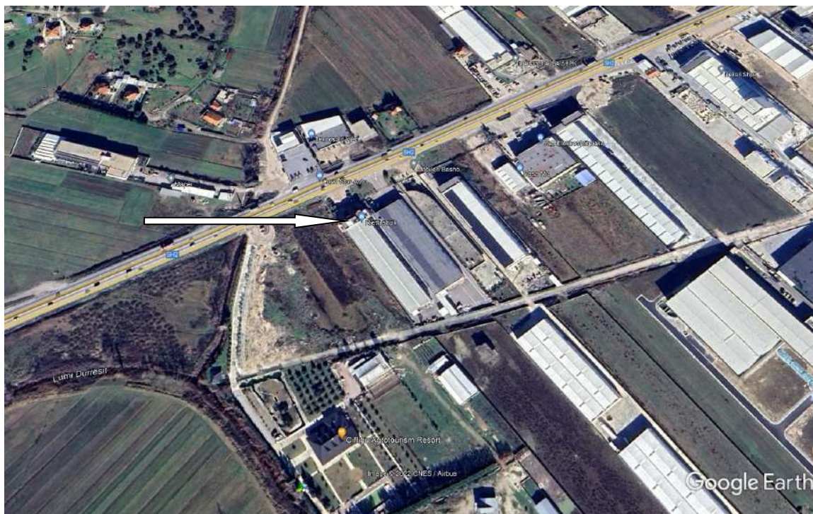
Pamje e vendosjes se aktivitetit

Siperfaqia ku zhvillohet aktiviteti 2414 m2,