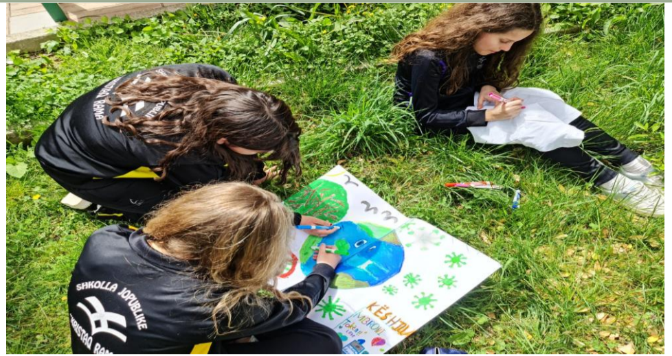
Aktivitete në natyrë: Dita e Tokës