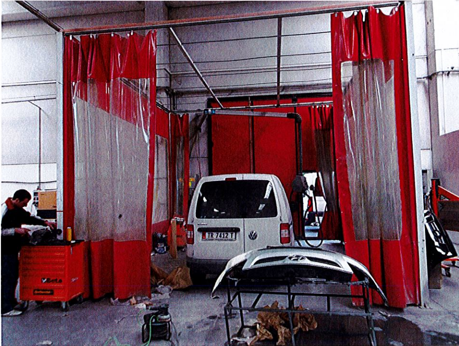
Dhoma e lyerjes