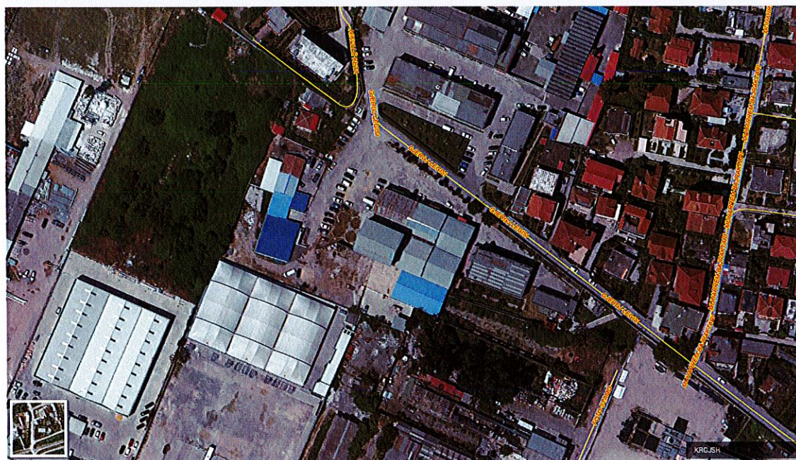
Pamje satelitore e zones ku ndodhet aktiviteti i shoqërisë "Auto Stafa" Sh.p.k.