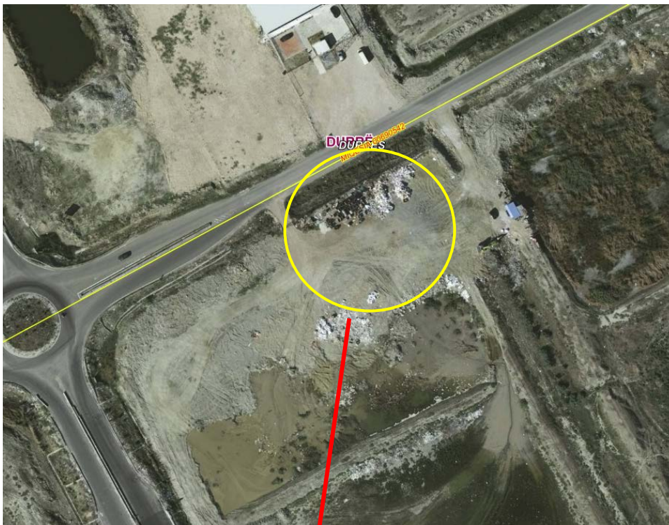
Figure 1 Harta e zones ne vleresim

Qëllimi i aktivitetit është Stacion Transferimi i Mbetjeve te Rrezikshme te cilat i referohen vajrave portuale, te portit te Duresit me te cilin subjekti “Roan Trans” ka lidhur kontrate Prokurimi “Sherbime” Pastrimi i ambienteve te jashtme te APD-se. Si dhe Stacion Transferimi i Mbetjeve Jo te Rrezikshme , mbetje te cilat i referohen Fraksionet e ndara (përveç 15 01 , ambalazheve), Mbetjet e kopshteve dhe parqeve (përfshirë mbetjet e varrezave), Ambalazhe (duke përfshirë mbetjet e paketuara urbane), Mbetje Urbane, Mbetje te paspecifikuara, Mbetje qe dalin nga perpunimi i drurit, mbetje nga impjantet e trajtimi etj.