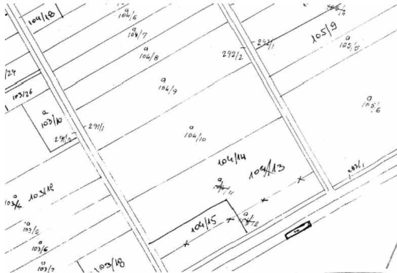
Harta treguese e regjistrimit

Aktiviteti Stacion Transferimi per Mbetje te Rrezikshme dhe Mbetje Jo te rrezikshme, do te zhvillohet ne zonen teknologjike Spitalle Durres ne pronen me nr pasurie Nr. 283/3/ND dhe zone kadastrale 8517.