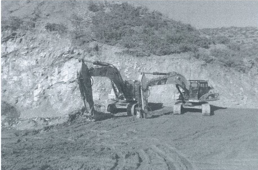
Foto e mbuleses bimore te sip. se karieres

Mbulesa bimore e sipërfaqes së karrierës karakterizohet nga shkurre, të llojit dellinje, bush, shkoze.