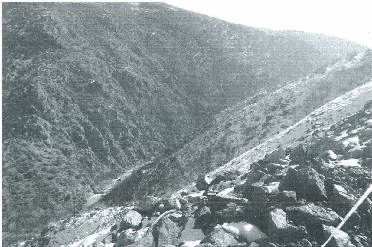
Foto e proit Leshnice

Ne anen Lindore te karieses,ne kembet e malit te SHPATIT,kalon proi i Leshnices,qe derdhet ne liqenin e Kukesi