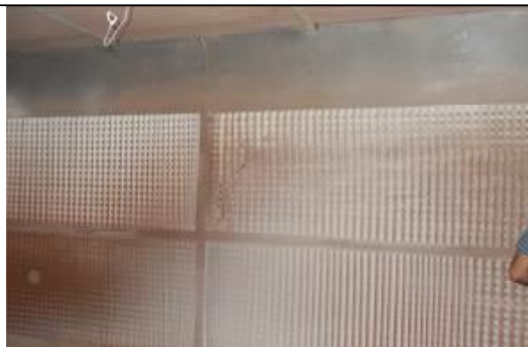
Transportier i produktit te gatshem