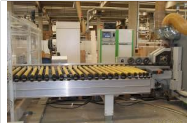
Makineri prerese e paisur me sistem thithes te mbetjeve te tallashit