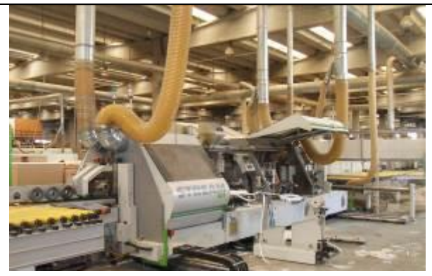
Sistemi i aspirimit qendror