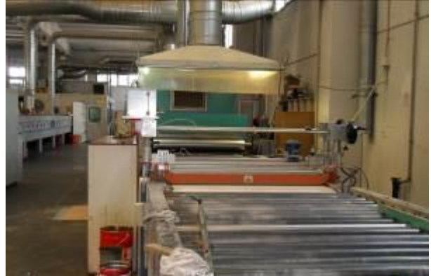
Makineri me sistem te kapjes se grimcave