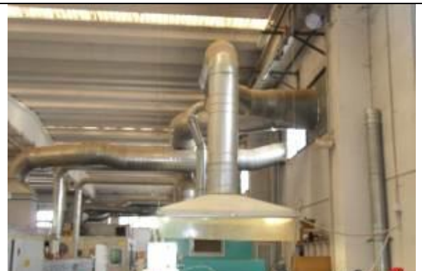
Sistemi zjarrfikese i ndertuar ne objekt te vecante