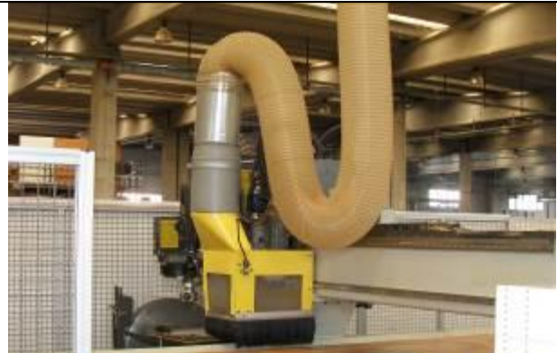
Sistemi i grumbullimit te tallashit