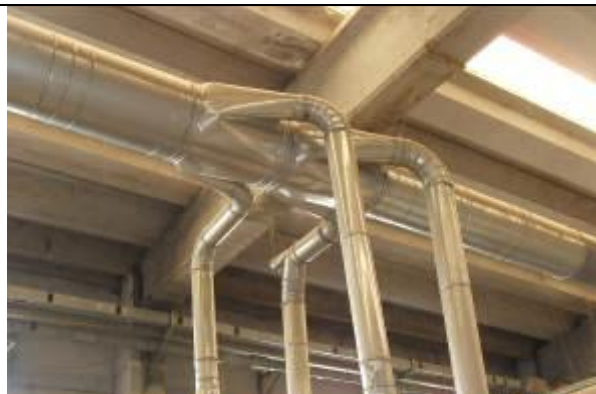
Mbledhja dhe riperdorimi i materialit ngjites