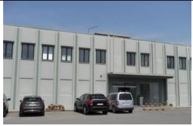
Makineria e lyerjes me sistem aspirimi