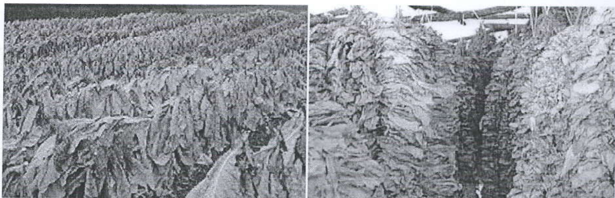
Figura 2: Tharja e gjetheve te duhanit