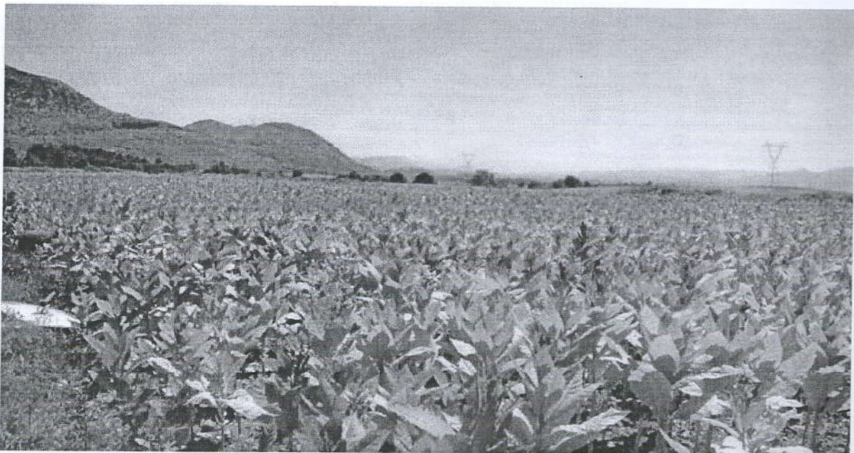
Figura 1: Fusha te mbjella me duhan