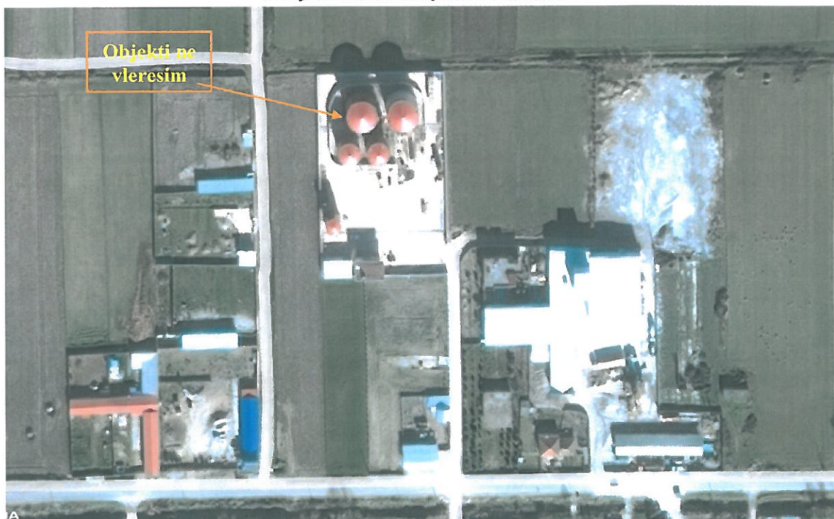
Pamje satelitore e objektit ne vleresim

Aktiviteti i subjektit, do te ushtrohet prane rruges "Eleni Gjika", ne afersi te fshatit "Mbrostar Ferko", Bashkia Fier. Per ne hyrjen e objektit sherben rruga qe lidh lagjen "Mbrostar Ferko" me qytetin e Fierit dhe konkretisht me unazen verilindore. Objekti ndodhet rreth 2 km larg nga qendra e qytetit te Fierit.