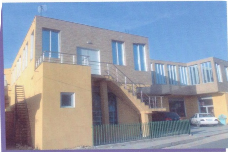
Foto ku ushtrohet veprimtaria