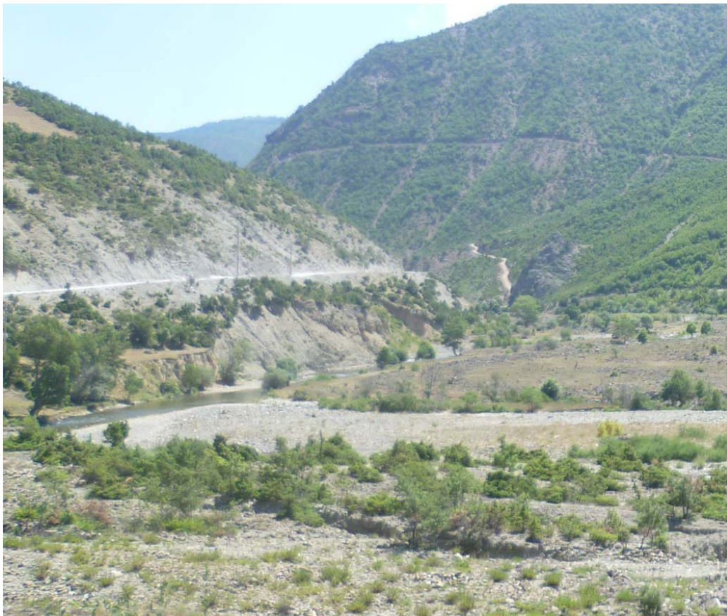
Foto nga zona ku do te shfrytezohet

Dushku ne zone eshte i degraduar dhe siperfaqja e tyre vjen gjithmone duke u pakesuar. Si element te nenpyllit mund te permendim dellinjen, shkozen, shkurre ferrash, megjerishten, frasheri, etj. Nen kete kat te shkurreve rriten bimet barishtore, perfaqesuese te familjes graminore. Vende – vende ne zonen ku do te shfrytezohet mungon bimesia dhe kemi shfaqje shkembore.