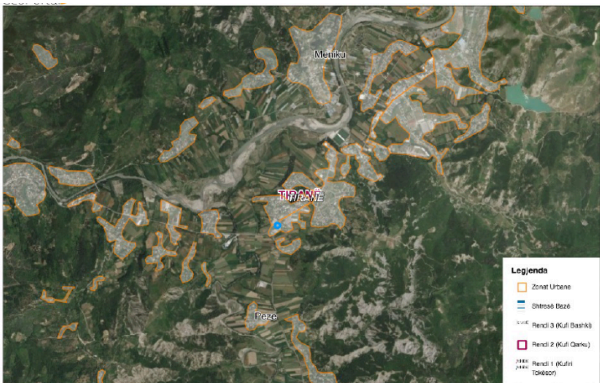
Figure 2 – Harta e zonave te banuara

Zona ku ushtrohet aktiviteti ekzistues shtrihet ne brendesi te zonave te sisteit urban referuar propozimit të fundit të PPV, miratuar me vendim të KKT Nr. 1, datë 14.04.2017 “Për Miratimin e Planit të Pergjithshëm Vendor, Bashkia Tiranë” paraqitur edhe ne hartën me meposhteme. Aktiviteti eshte lehtesisht i aksesueshem pasi shtrihet pegjate rruges nationale Tirane – Ndroq – Durres.