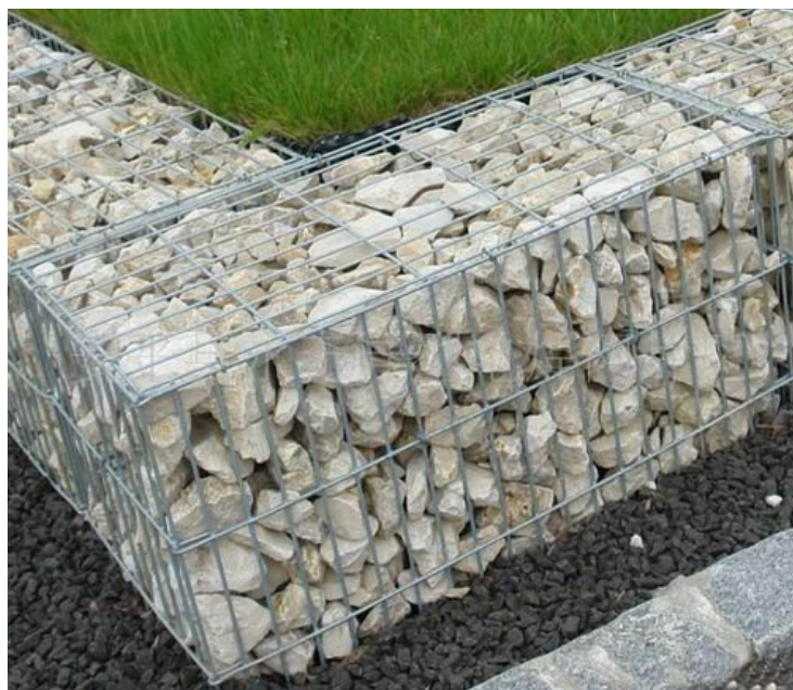
Foto ilustruese, Shembull sistemimi për vendgrumbullimin, ku është mbjellur bar si vegjetacion