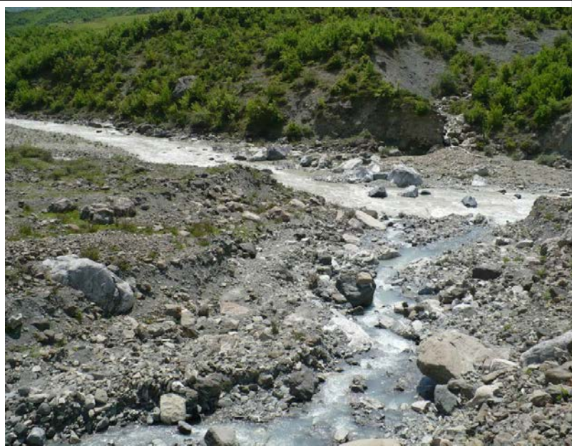
Foto nga terreni, shtrati I perrenjve

Gjate fazes se shfrytezimit keto dukuri do te zbehen. Theksojme qe per shkak te projektit nuk do te lejohet zvogelim te habitatit te specieve ujore, sepse lumi bashke me deget e saj perben nje ekosistem me vlera jetike per shume specie ujore (si amfibe, krimba, bime ujore, etj) te cilet jane pjese e rendesishme e zinxhirit ushqimor ne ambientin ujor.