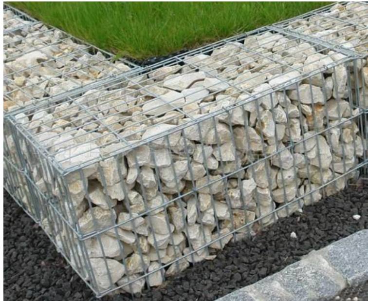
Foto ilustruese, Shembull sistemimi per vendgrumbullimin, ku eshte mbjellur bar si vegetacion

Nje pjese e materialeve te ngurta (gure te madhesive te ndryshme) merret e do te depozitohet ne ane te shtratit te vepres per te realizuar kijimin e shtresave vegjetale e mbjedhjen e pemeve per mbrojtjen nga erozioni i metejshem.