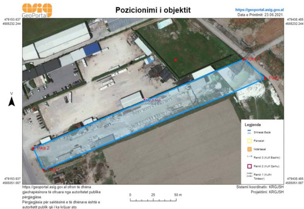
Fig.1. Ortofoto e vendndodhjes së veprimtarisë (Sipas sistemit koordinativ- Albanian 1986/Gauss-Kruger Zone ) .