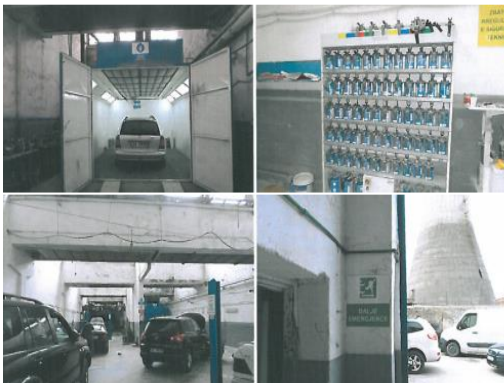
Foto te aktivitetit

Disa nga proceset e mirembajtjes që kjo pike servisi ofron janë: