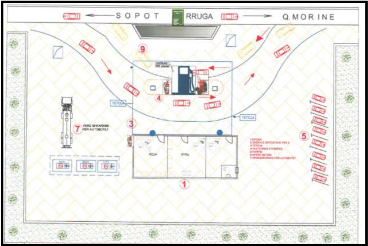
PLANVENDOSJA E AKTIVITETIT