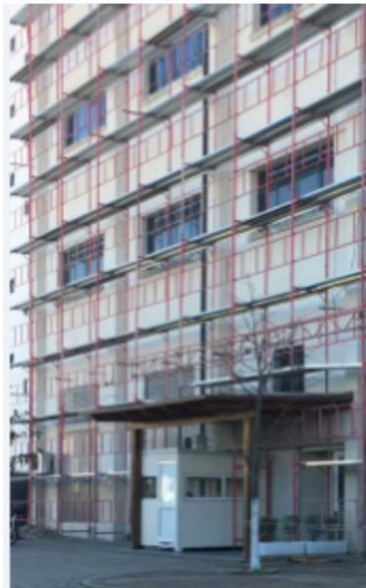
Figura 4.Pamje e pjeses anesore e cila perkon me mjediset e parkimit

Ne paragrafet e meposhtem do te pershkruben ndikimet e mundshme qe aktiviteti mund te kete kryesisht gjate funksionimit te tij ekonomik.