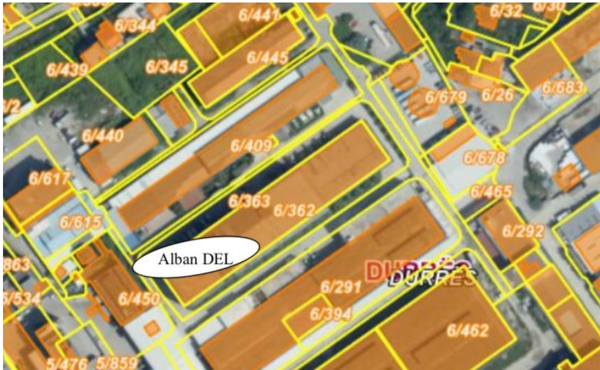
Figura 2. Pamje e zmadhuar e vendit ku ushtrohet aktiviteti.

Pasqyrimi i koordinatave ku gjendet aktiviteti per prodhimin e kepeceve.