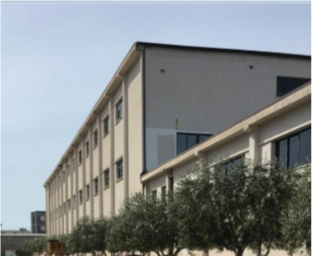
Figura 3.Pamje ne pjesen perpara godines.