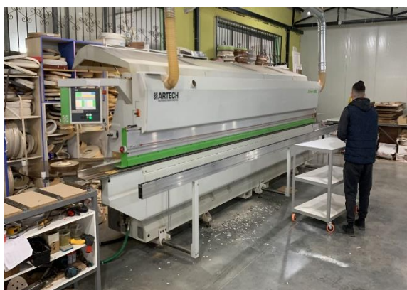
FOTO TE AMBJENTIT TE AKTIVITETIT