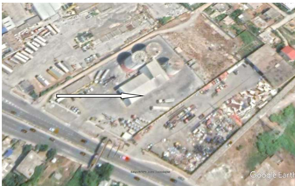
Pamje e vendosjes së aktivitetit

Sipërfaqja totale e sheshit ku zhvillohet aktiviteti 7174 m 2