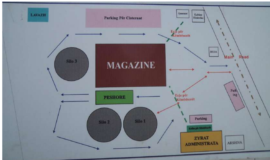
Pamje e skemes se terminalit e e afishuar ne hyrje te terminalit.