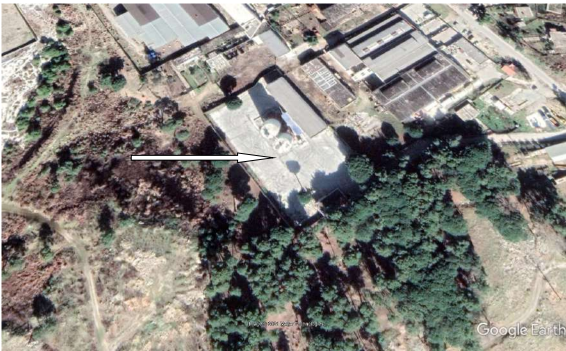
Pamje e vendosjes së aktivitetit

Sipërfaqja totale e sheshit ku zhvillohet aktiviteti 4.000 m 2