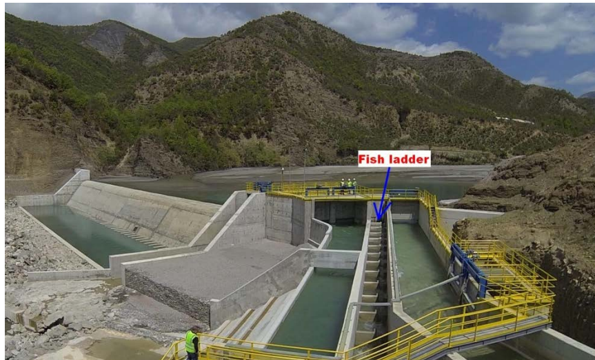
Foto , Shembull e kalimit te peshqve tek vepra e marrjes

Kalimi i Peshqve eshte parashikuar te behet sipas standardeve europiane, ku eshte respektuar menyra e levizjes se peshqve dhe gjithashtu eshte bere ne respektim te ndikimit pamor ne mjedis. Stafu ka verejtur se tipi i perzgjedhur per "fish passage" dhe zbatimi ne objekt I tij eshte ne perputhje te plote me normat dhe kerkesat mjedisore per objekte te tilla. Ne vepren e marrjes do te ndertohej "fish ladder" me beton per nje distance te shkurter ,e cila mendojme se eshte zgjidhje e mjaftueshme ne kete rast dhe me pas me ane te nje "rock ramp – bypass fishway" kalon ne rrjedhen normale ne lumit.