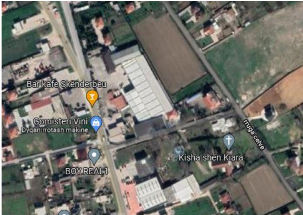
Figura 1. Pamja e larget e subjektit

Ne figurat e meposhtme jepet vendndodhja e aktivitetit.