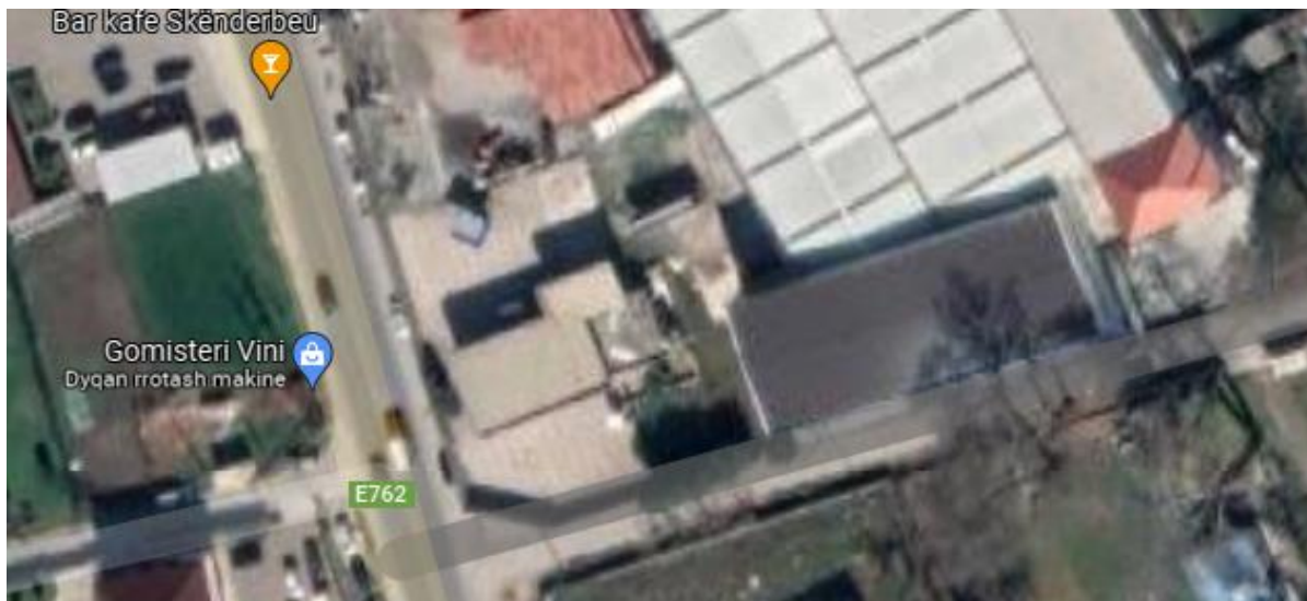
Figura 2 Pamja e afert e subjektit

Subjekti per te ushtruar aktivitetin e tij ekonomik ka marre nje hapësire me qera (Kontrate qeraje dt.27.11.2021, me nr.rep.8849, Nr. Kol. 4481.) e cila perbehet nga rreth 300 m2 ku nga subjekti ne fjale perdoret vetem 107 m2. Siperfaqja e marre me qera eshte godine nje kateshe.