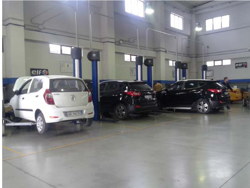
Pamje e plote e servisit