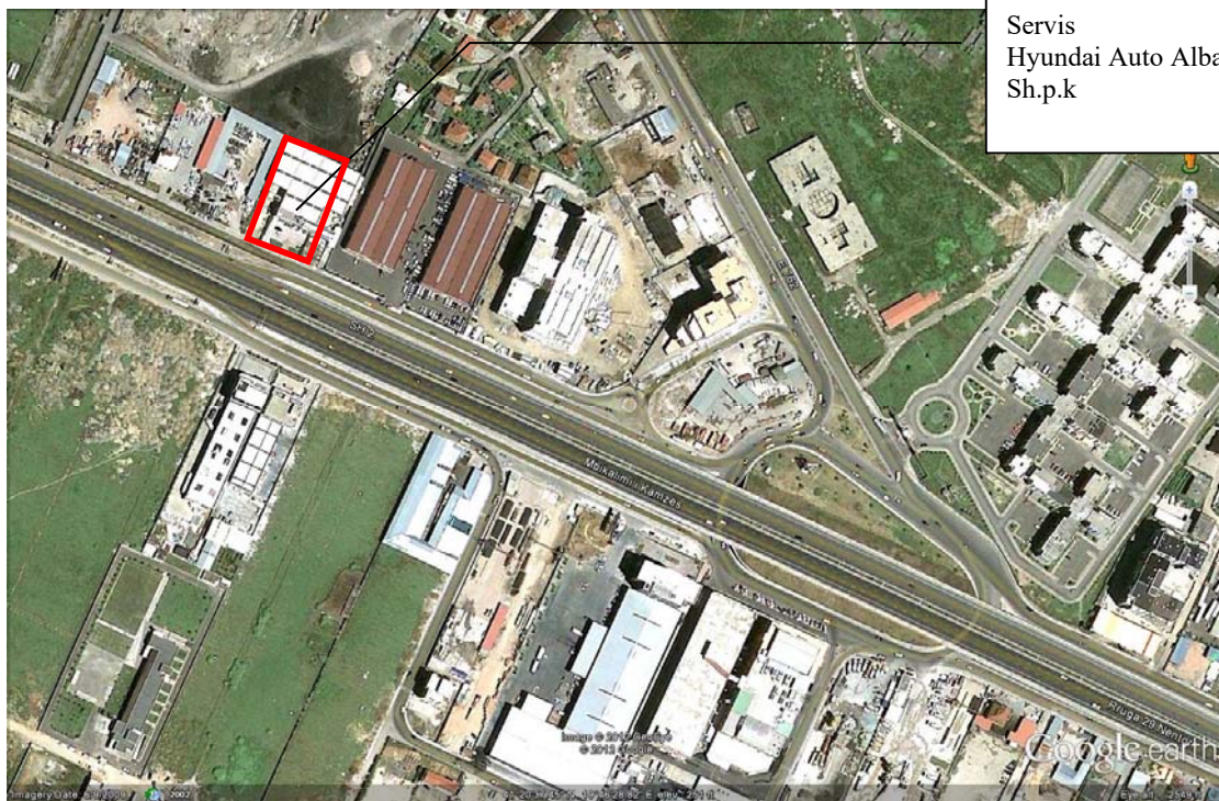
Pamje satelitore e zones ku ndodhet aktiviteti i shoqerise "Hyundai Auto Albania" Sh.p.k.