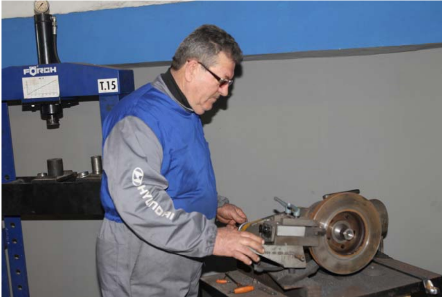
pajisje per tornim tamburesh