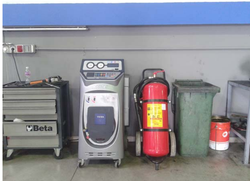
pajisje rikuperimi dhe furnizimi e gazit ftohes te autoveturave