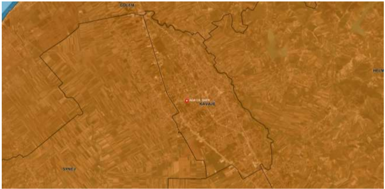
Figure 1 – Harta e ndarjes administrative te bashkise Kavaje. (Burimi: ASIG Geoportal)

Zona ku ushtrohet aktiviteti ekzistues shtrihet ne brendesi te zonave te sistemit urban referuar propozimit të fundit të PPV, miratuar me vendim të KKT Nr. 7, datë 28.12.2020 “Për Miratimin e Rishikimit të Planit të Pergjithshëm Vendor, Bashkia Kavaje, te Miratuar me Vendim nr. 2, date 27.04.2018 te KKT” paraqitur edhe ne hartën me meposhteme. Aktiviteti eshte lehtesisht i aksesueshem pasi shtrihet pergjate rruges kryesore.