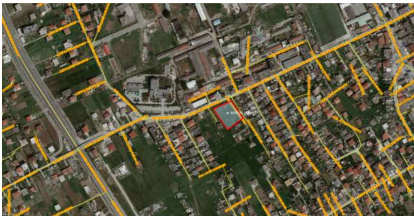
Figure 3 – Harta e infrastruktures rrugore ne zonen e aktivitetit

Aktiviteti në vlerësim ndodhet në ne lagjen Nr.3, rruga e spitalit (Synej), Bashkia Kavaje, objekti me Nr.Pasurise 1/732, zona kadastrale 8552. Sheshi ku do zhvillohet aktiviteti në fjale ndodhet ne brendesi te prones dhe nuk cenon pronat e tjera perreth.