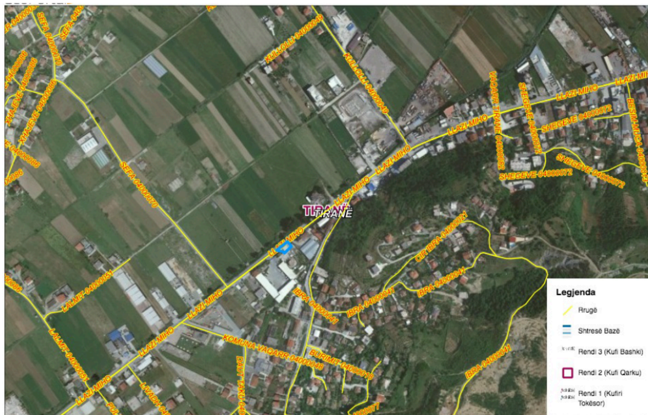
Figure 3 – Harta e infrastrukturës rrugore në zonën e aktivitetit

Aktiviteti në vlerësim ndodhet në rrugën “Llazi Miho”, pasuria nr. 81/12, zona kadastrale 3712, Njesia Administrative Vaqarr, Bashkia Tirane. Sheshi ku do zhvillohet aktiviteti në fjalë ndodhet në brendësi të pronës dhe nuk cenon pronat e tjera përreth.