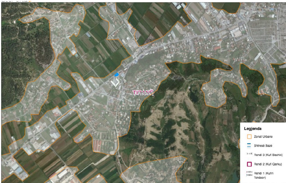
Figure 2 – Harta e zonave te banuara

Zona ku ushtrohet aktiviteti ekzistues shtrihet ne brendesi te zonave te sisteit urban referuar propozimit të fundit të PPV, miratuar me vendim të KKT Nr. 1, datë 14.04.2017 “Për Miratimin e Planit të Pergjithshëm Vendor, Bashkia Tiranë” paraqitur edhe ne harten me meposhteme. Aktiviteti eshte lehtesisht i aksesueshem pasi shtrihet pegjate rruges “Llazi Miho”.