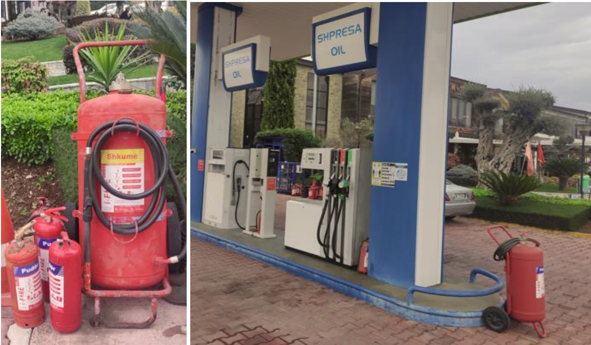
Figura 3. Pamje e mjeteve ne rast zjarri

Aktiviteti ne fjale eshte nje aktivitet me rrezikshmeri te larte te zjarrvenies, megjithate, kompania ka instaluar sisteme hidrant, depozita uji, si dhe eshte pajisur me fikese zjarri me shkume per te evituar zjarrin ose perhapjen e tij ne cdo rast. Hidrantet furnizohen me uje nga tubacione celiku dhe mbulojne teresisht territorin e jashtem dhe te brendshem.