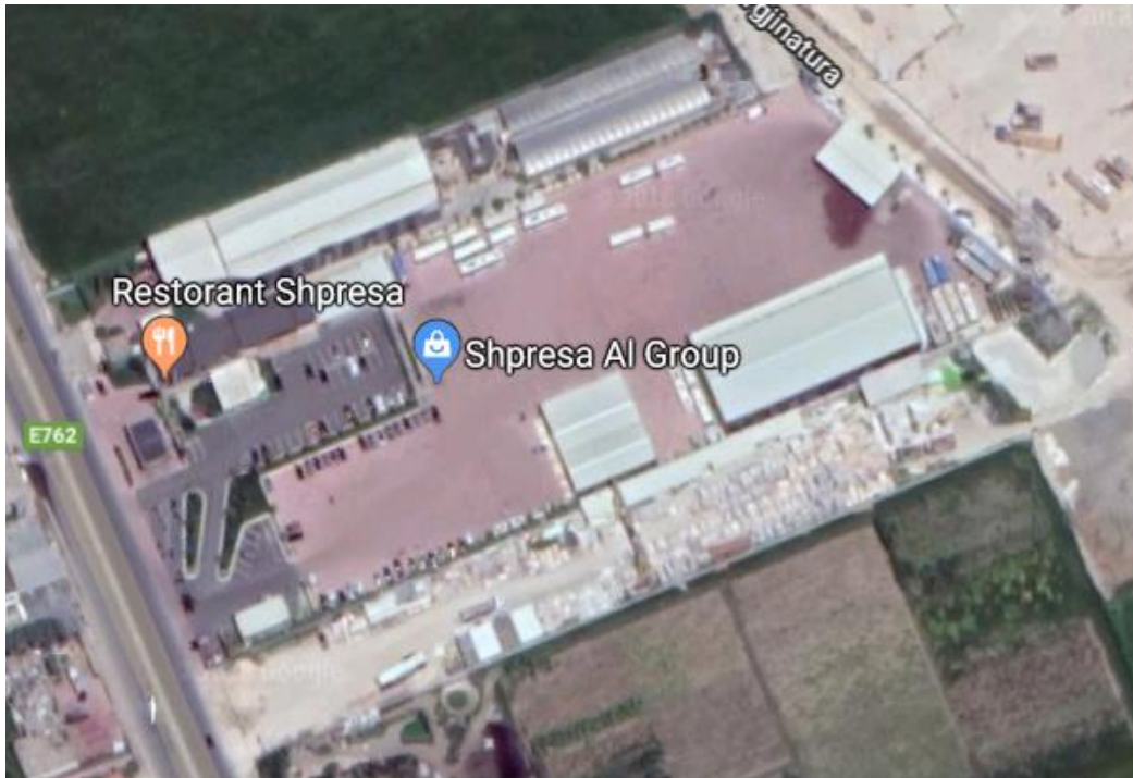
Figura 2 Pamja e afert e subjektit

Mjedisi ku ushtrohet aktiviteti ekonomik eshte ne pronesi te subjektit dhe ka te dhena si me poshte: Zona kadastrale 2066, nr pasurie 344/19, vol19, faqe 97, Truall, me indeks harte K-34-88-(201-C).