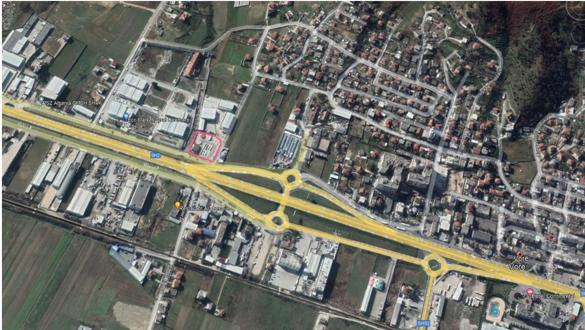
Figura 1: Zona e projektit dhe rrugët kryesore

Si burim kryesor i ndikimeve në ajër janë mjetet e ngarkim shkrkimit të mbetjeve. Ky ndikim është i parëndësishëm për zonën pasi objekti ndodhet në kufi me rrugën dhe e rrethuar me aktivitet të tjera tregtare.