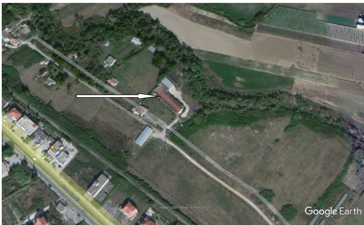
Pamje e vendosjes se aktivitetit

Siperfaqia totale e truallit ku zhvillohet aktiviteti 3353 m2,