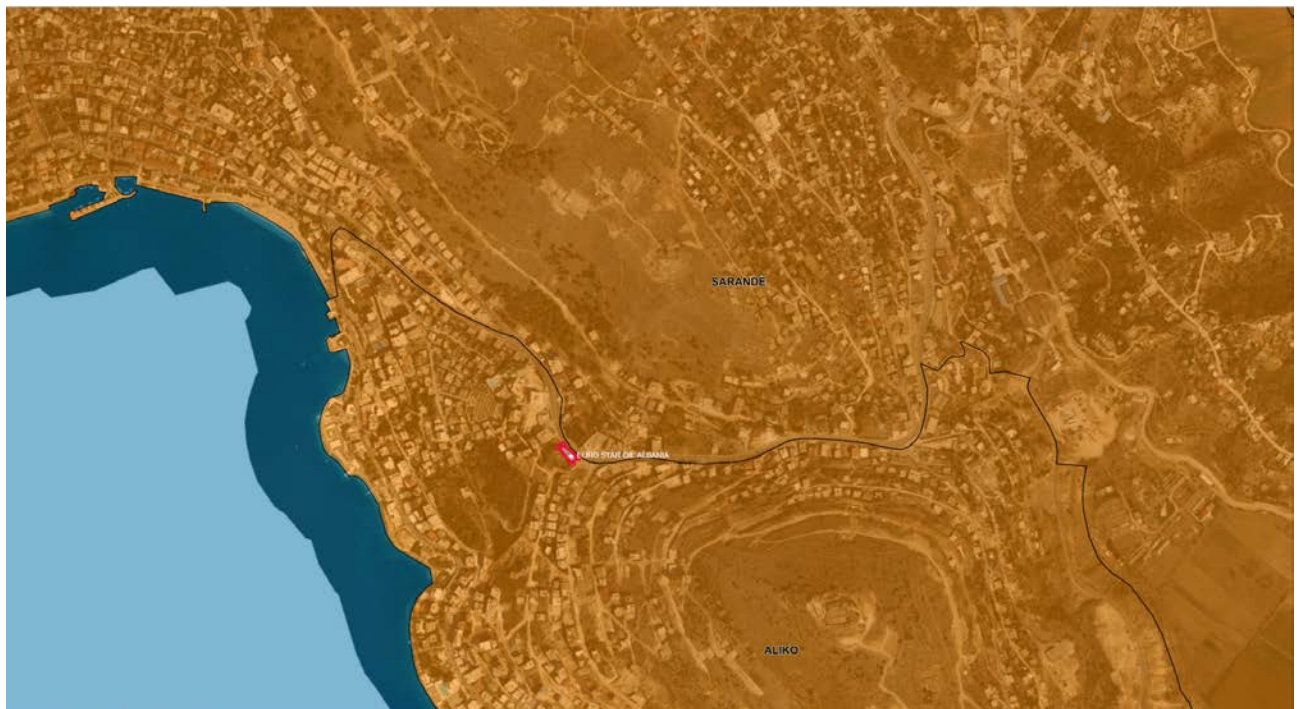
Figure 1 – Harta e ndarjes administrative e Bashkise Sarande.

Zona ku ushtrohet aktiviteti ekzistues shtrihet ne brendesi te zonave te sistemit urban referuar propozimit të fundit të PPV, miratuar me vendim të KKT Nr. 1, datë 14.04.2017 “Për Miratimin e Planit të Pergjithshëm Vendor, Bashkia Tiranë” paraqitur edhe ne harten me meposhteme. Aktiviteti eshte lehtesisht i aksesueshem pasi shtrihet pergjate rruges “Tre Bilbilenjte”.