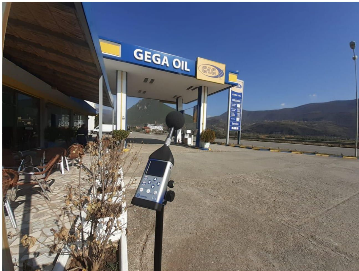
Foto te objektit

Në afërsi të zonës ku zhvillon aktivitetin subjekti “GEGA CENTER GKG” nuk ka shkolla, vepra arti, argjinatura, linjë elektrike të tensionit të lartë dhe linjë uji që mund të dëmtohen nga zhvillimi i aktivitetit për “Furnizim me karburant i makinave dhe Impiant i tregetimit te gazit për makinat/gatim/ngrohje” .