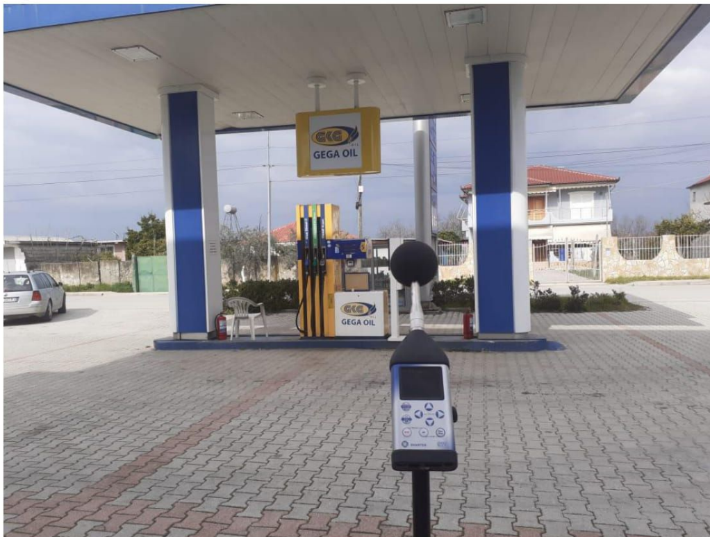
Foto te objektit

Në afërsi të zonës ku zhvillon aktivitetin subjekti “GEGA CENTER GKG” nuk ka shkollë, vepra arti, argjina, linjë elektrike të tensionit të lartë dhe linjë uji që mund të dëmtohen nga zhvillimi i aktivitetit për “Furnizim me karburant i makinave dhe Impiant i tregetimit të gazit për makinat/gatim/ngrohje” .