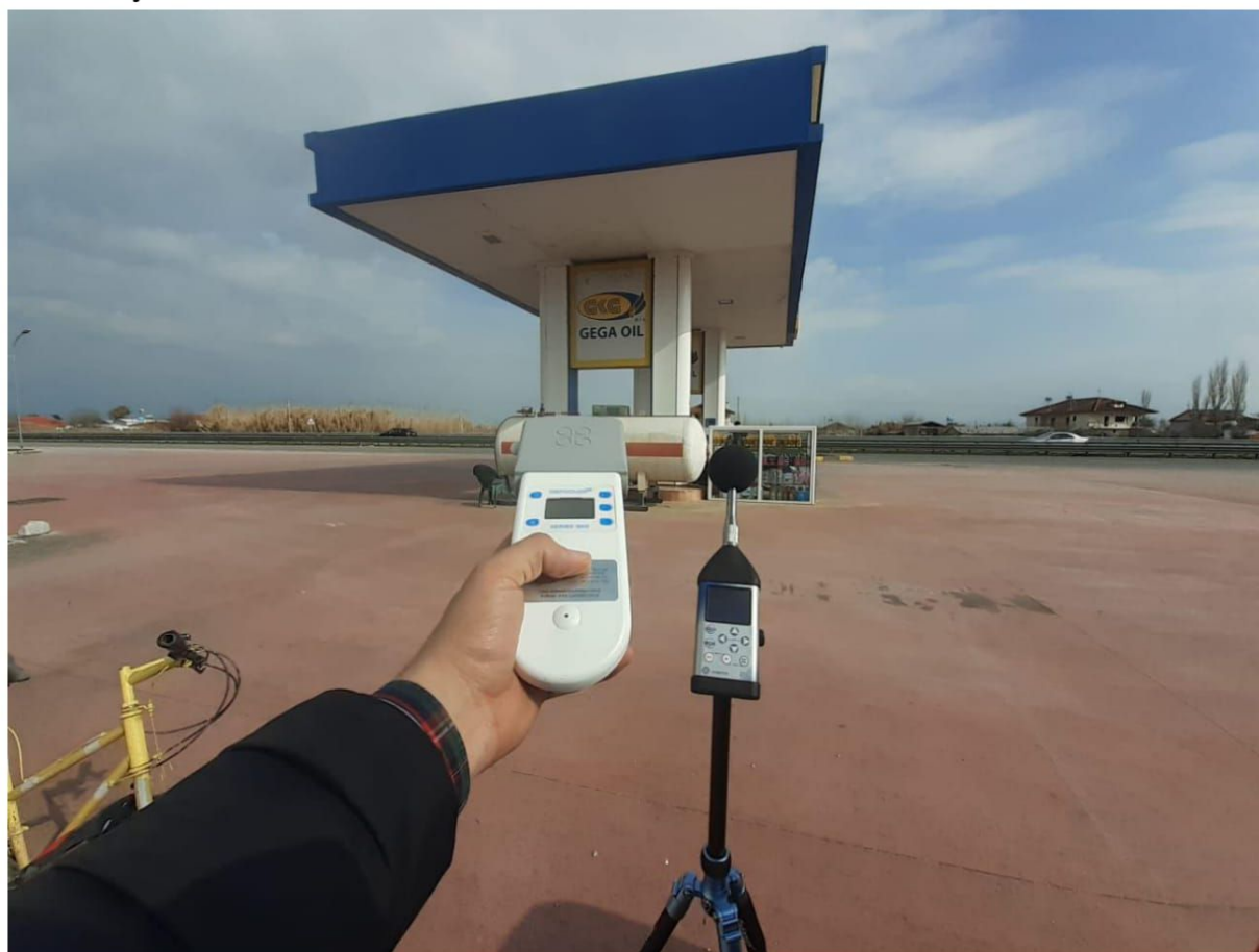
Foto te objektit

Në afërsi të zonës ku zhvillon aktivitetin subjekti “GEGA CENTER GKG” nuk ka shkolla, vepra arti, argjinaura, linjë elektrike të tensionit të lartë dhe linjë uji që mund të dëmtohen nga zhvillimi i aktivitetit për “Furnizim me karburant i makinave dhe Impiant i tregetimit te gazit për makinat/gatim/ngrohje” .