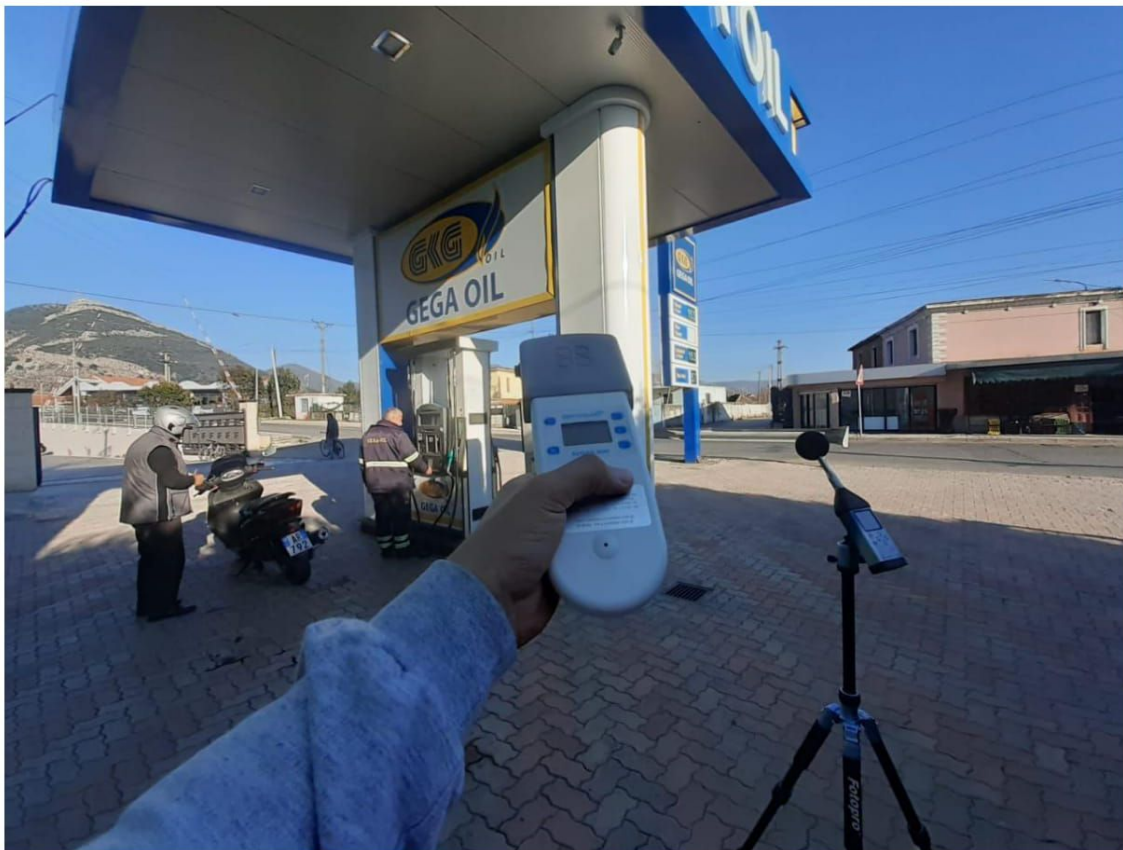
Foto të objektit

Në afërsi të zonës ku zhvillon aktivitetin subjekti “GEGA CENTER GKG” nuk ka shkollë, vepra arti, argjina, linjë elektrike të tensionit të lartë dhe linjë uji që mund të dëmtohen nga zhvillimi i aktivitetit për “Furnizim me karburant i makinave dhe Impiant i tregetimit të gazit për makinat/gatim/ngrohje” .