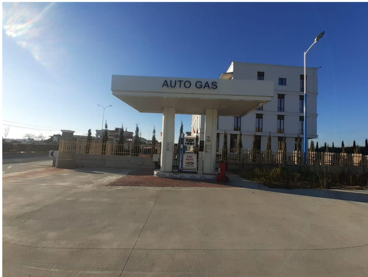
Foto te objektit

Në afërsi të zonës ku zhvillon aktivitetin subjekti “GEGA CENTER GKG” nuk ka shkolla, vepra arti, argjinatura, linjë elektrike të tensionit të lartë dhe linjë uji që mund të dëmtohen nga zhvillimi i aktivitetit për “Furnizim me karburant i makinave dhe Impiant i tregetimit të gazit për makinat/gatim/ngrohje” .