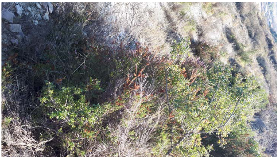
Bimesia e siperfaqes se objektit