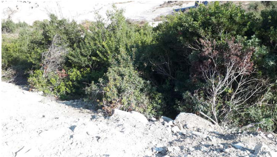
Pamje e bimesisise, perralla, xina dhe shqop, mare