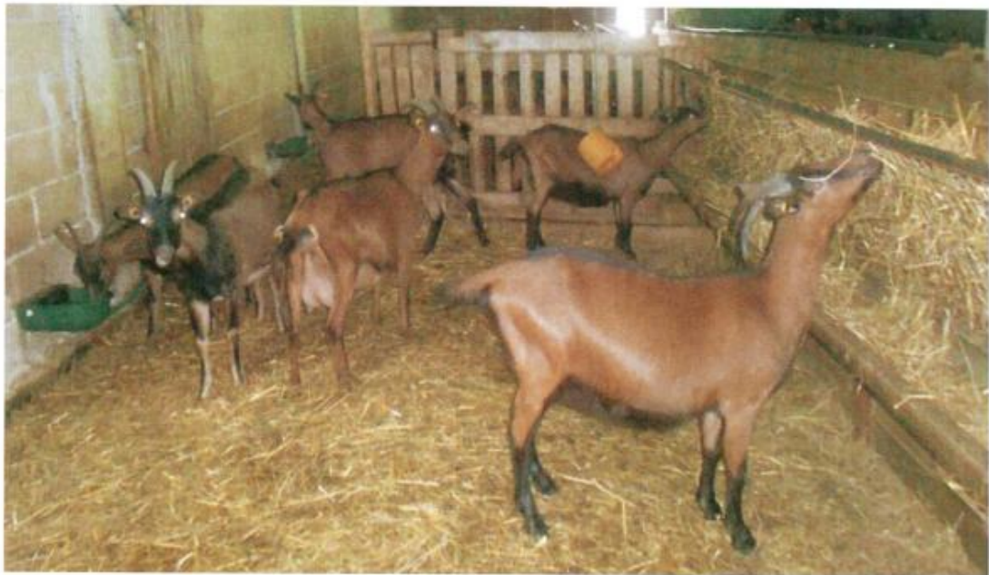
Figure 3. Kecat 1 -vjeçarë të racës Alpine në stallën e "American Farm"

Raca Alpine Franceze është një racë europiane e krijuar në Alpe, ndërmjet kryqëzimit të racave vendase të dhive me racën Saanen. Ka një shpërndarje të gjerë në Francë, duke zënë 70% të totalit të numrit të dhive atje. Dhia e racës Alpine Franceze është e shkathët dhe ka një zhvillim të mirë trupor. Është një racë dhie e mbushur, rezistente dhe përshtatet lehtësisht në kushtet klimaterike. Femrat kanë një përmasë afërsisht 75 cm dhe një peshë trupore 60-70kg. Përmasat e meshkujve janë më të mëdha, 80-100 cm, dhe peshë 75-90 kg. Ngjyra është e kuqerremtë në shpinë, në fytyrë dhe në zonën e bishtit. Prodhimi vjetor i qumështit varion nga 650-750 litra në 250 ditë me një yndyrë prej 3.5 %. Në një studim të zhvilluar në Francë për 168.872 dhi nga raca Alpine Franceze, u përftua mesatarisht një prodhim prej 747 l qumësht, me një përmbajtje 31.3 g proteine l/qumësht dhe 35.6 g yndyre l/qumësht në 276 ditë prodhimi.