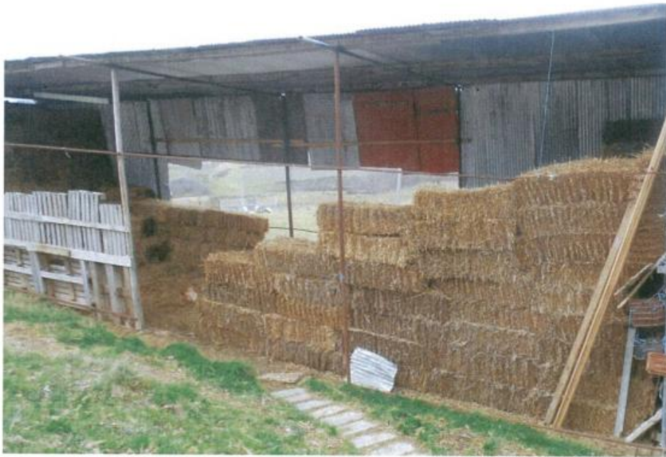
Figure 4. Vend-magazinimi i bazës ushqimore

Tipike për këtë rracë është kërkesa për mbarështimin në regjim stallor. Për këtë subjekti ka ndërtuar stallën përkatëse të ndarë në bokse dhe të pajisur me vendin e hedhjes së barit, misrit, ujit. Ushqimet që përdoren për bagëtinë janë të gjitha natyrale apo edhe organike, si bari i thatë dhe i njomë, jonxha, kashta, misri i thatë, etj. Baza ushqimore ruhet në një vend-magazinimi (hangar të mbuluar) (Figura 4).