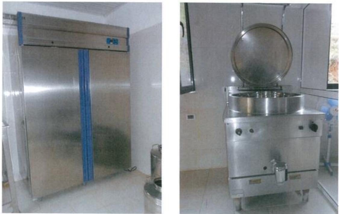
Figure 5. Pajisjet për pasterizimin dhe përpunimin e qumështit

Dhitë milen rregullisht dy herë në ditë dhe qumështi i grumbulluar kalon në katin e dytë për pastrim, pasterizim dhe prodhimin e djathit. Përpunohet rreth 200 l qumësht në ditë. Djathi u shitet bizneseve të zonës. Në Figurën 5 tregohen disa nga paisjet teknologjike të përdorura për trajtimin e qumështit dhe prodhimin e djathit. Aktiviteti i përpunimit të qumështit dhe prodhimit të produkteve blegtorale nga personi juridik "American farm" Sh. p.k. ka marrë edhe Akt Miratimin Higjeno Sanitar nga Drejtoria e Shëndetit Publik të rrethit Tiranë (Figura 6).