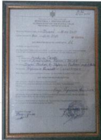
Figure 6. Akt Miratimi Higjeno Sanitar nga DSHP- Tiranë

Hapësira ku realizohen të gjithë aktivitetet e mbarështimit të të imtave janë të përshtatshme për këtë lloj aktiviteti dhe për funksionimin normal të tij. Sipërfaqja prej 5400 m 2 , është shfrytëzuar e tëra për investimin. Koeficienti i përdorimit të hapësirës tokësore është 10 % por siguron hapësirat e mjaftueshme lëvizëse dhe sigurinë e objektit dhe krijimin e një peisazhi harmonik me zonën përreth.