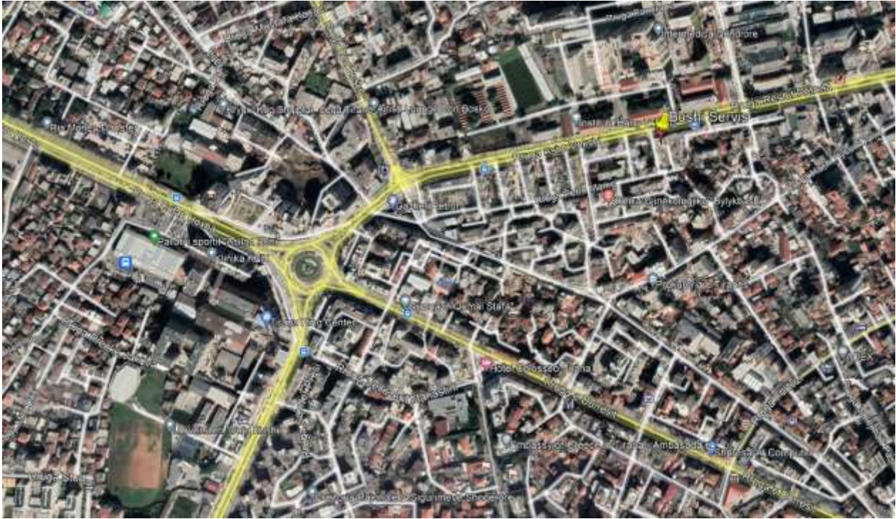
Figure 1. Vendodhja e aktivitetit