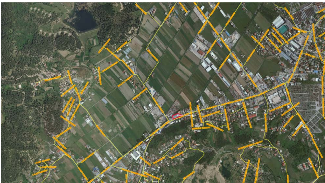
Figure 3 – Harta e infrastrukturës rrugore ne zonen e aktivitetit

Aktiviteti në vlerësim ndodhet në rrugën “Llazi Miho”, pasuria nr. 81/12, zona kadastrale 3712, Njesia Administrative Vaqarr, Bashkia Tirane. Sheshi ku do zhvillohet aktiviteti në fjale ndodhet ne brendesi te prones dhe nuk cenon pronat e tjera perreth.