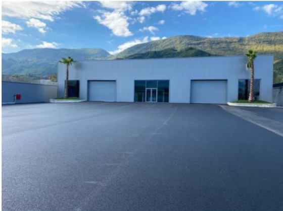
Foto të objektit ku do të zhvillohet aktiviteti

Në afërsi të zonës ku zhvillon aktivitetin subjekti “AUTO SALLON PALMANOVA” shpk nuk ka shkollë, vepra arti, argjinaura, linjë elektrike të tensionit të lartë dhe linjë uji që mund të dëmtohen nga zhvillimi i aktivitetit për “Autoservis dhe ljerje e mjeteve motorike” .