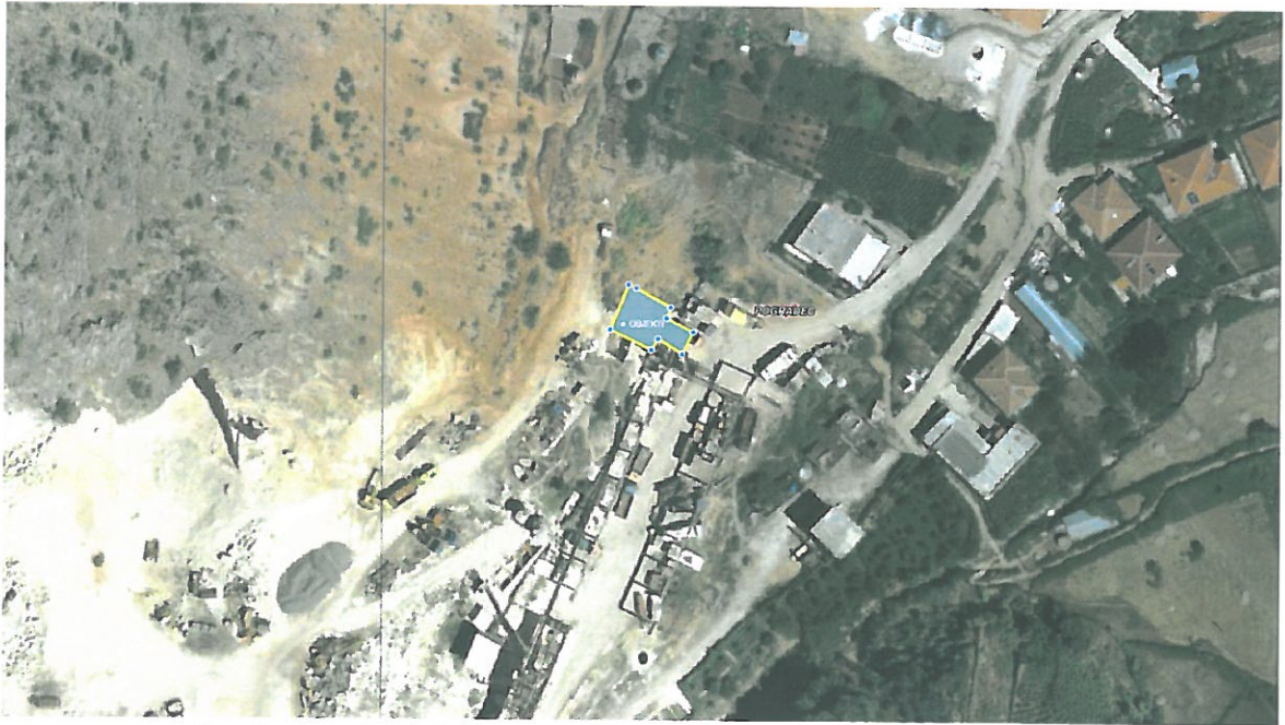
Ortofoto e objektit ku do te grumbullohen mbetjet e rrezikshme