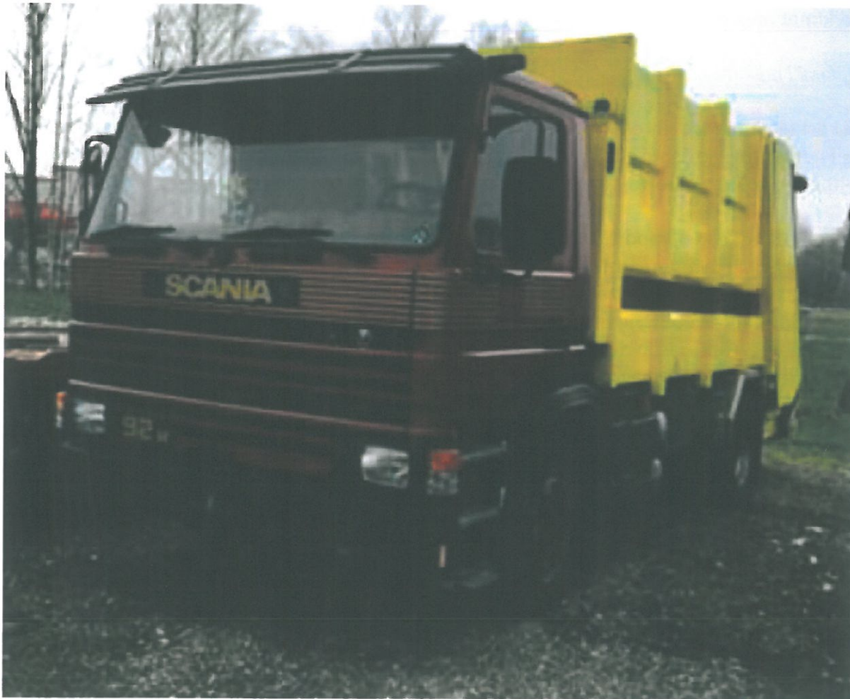
Pamje te njerit prej automjeteve qe subjekti REJ shpk disponon per ushrimin e aktivitetit