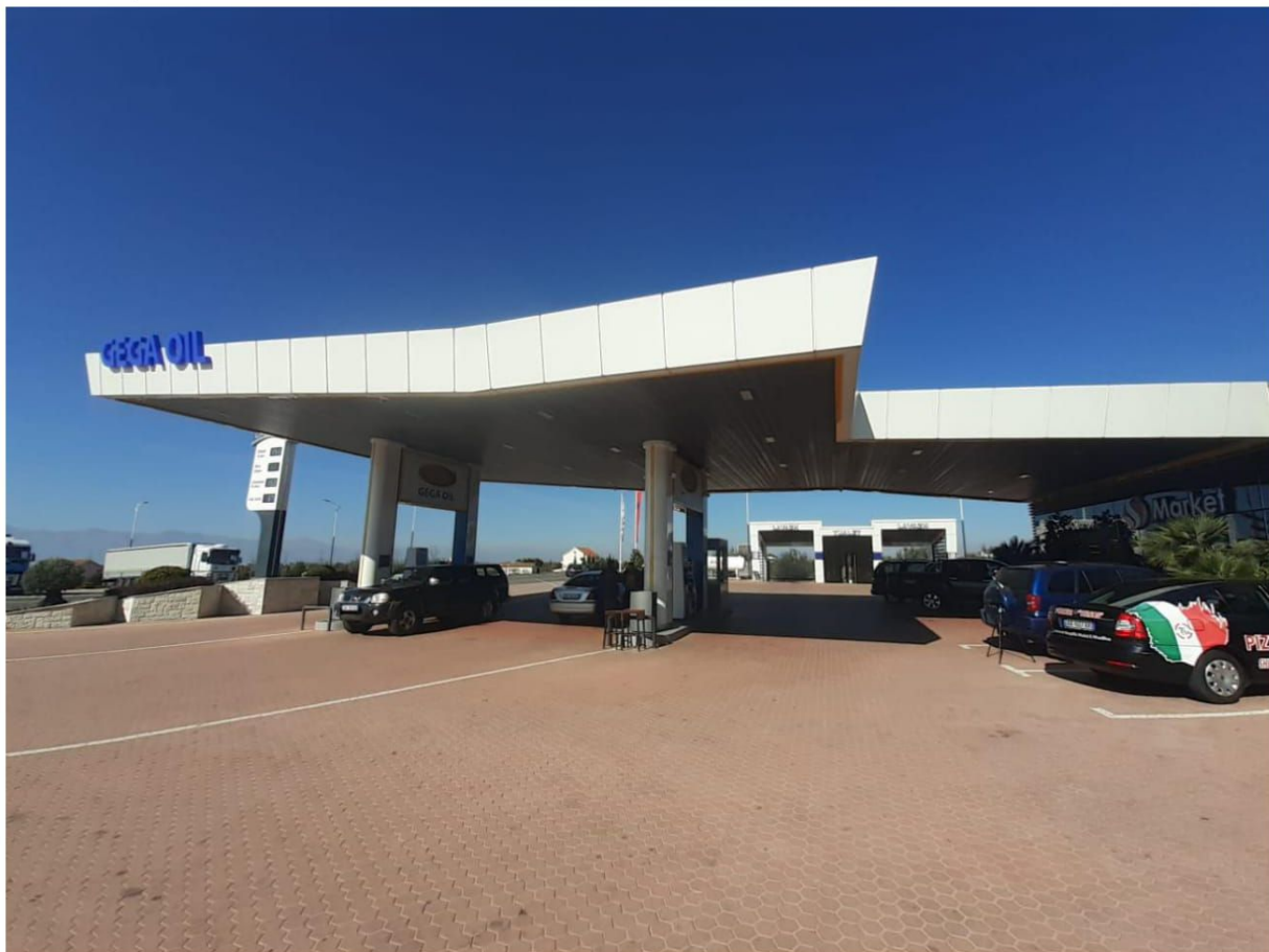
Foto te objektit

Në afërsi të zonës ku zhvillon aktivitetin subjekti “GEGA CENTER GKG” nuk ka shkolla, vepra arti, argjinatura, linjë elektrike të tensionit të lartë dhe linjë uji që mund të dëmtohen nga zhvillimi i aktivitetit për “Furnizim me karburant i makinave dhe Impiant i tregetimit të gazit për makinat/gatim/ngrohje” .