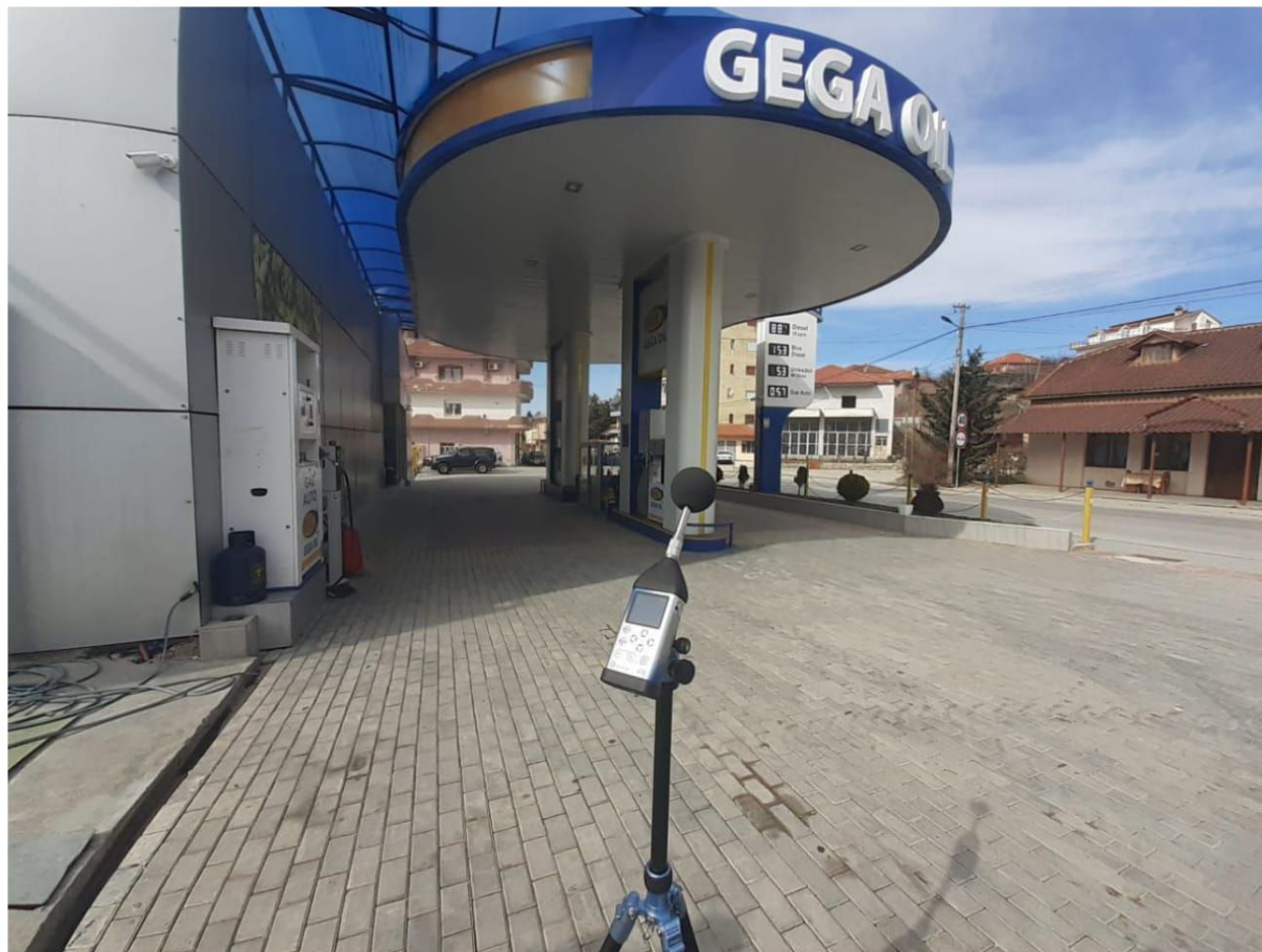
Foto te objektit

Në afërsi të zonës ku zhvillon aktivitetin subjekti “GEGA CENTER GKG” nuk ka shkolla, vepra arti, argjinatura, linjë elektrike të tensionit të lartë dhe linjë uji që mund të dëmtohen nga zhvillimi i aktivitetit për “Furnizim me karburant i makinave dhe Impiant i tregetimit të gazit për makinat/gatim/ngrohje” .