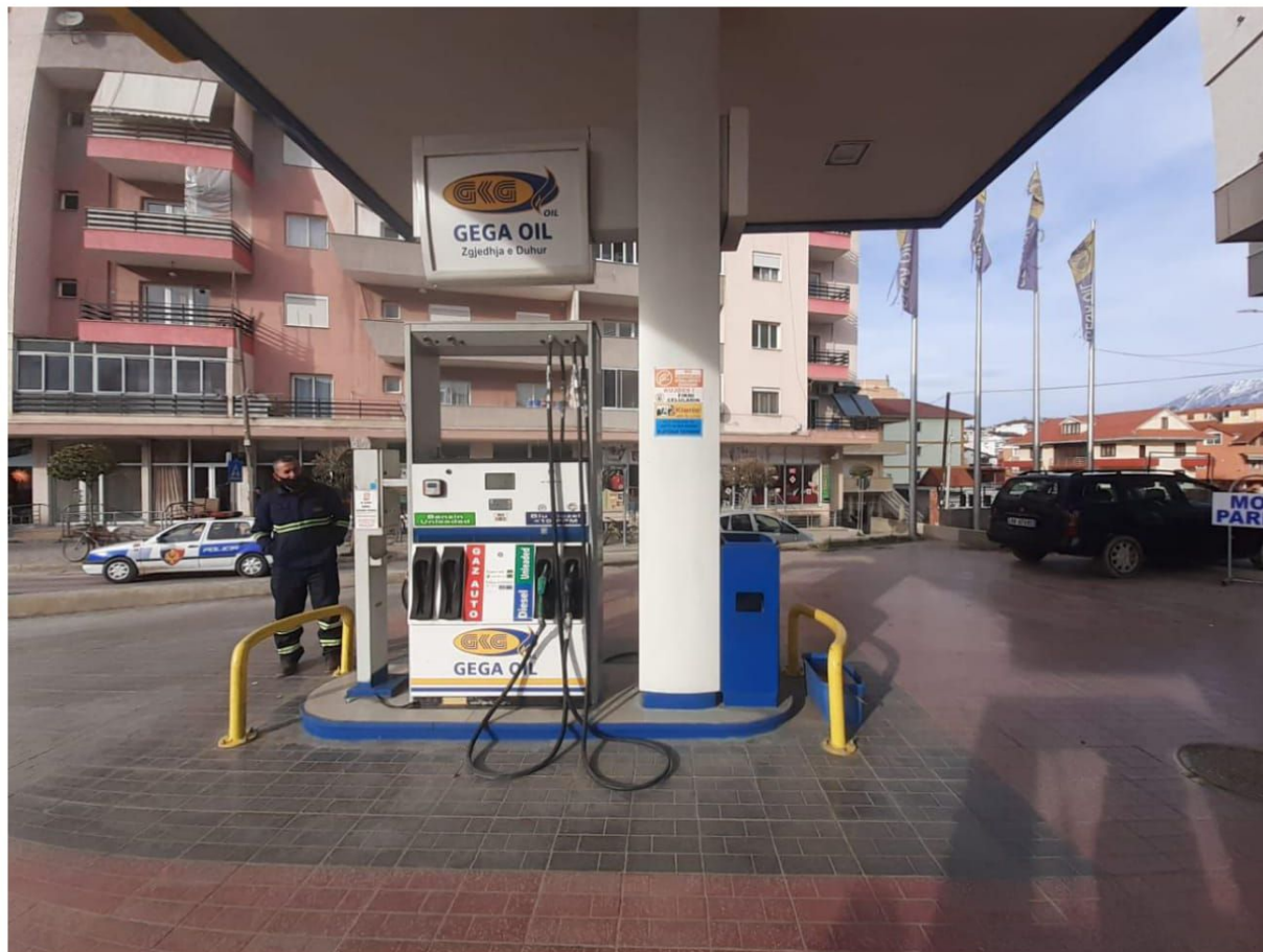
Foto te objektit

Në afërsi të zonës ku zhvillon aktivitetin subjekti “GEGA CENTER GKG” nuk ka shkollë, vepra arti, argjinatura, linjë elektrike të tensionit të lartë dhe linjë uji që mund të dëmtohen nga zhvillimi i aktivitetit për “Furnizim me karburant i makinave dhe Impiant i tregetimit të gazit për makinat/gatim/ngrohje” .