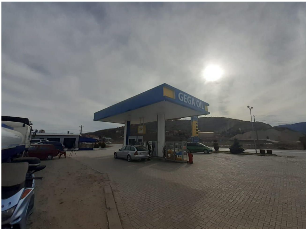
Foto te objektit

Në afërsi të zonës ku zhvillon aktivitetin subjekti “GEGA CENTER GKG” nuk ka shkolla, vepra arti, argjinatura, linjë elektrike të tensionit të lartë dhe linjë uji që mund të dëmtohen nga zhvillimi i aktivitetit për “Furnizim me karburant i makinave dhe Impiant i tregetimit te gazit për makinat/gatim/ngrohje” .