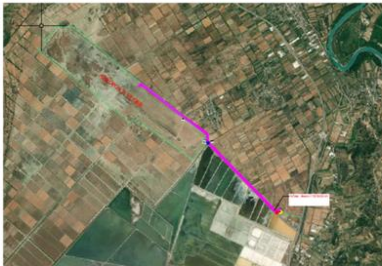
Figure 2 Planimetri e linjes 35kV nga Nst i ri deri tek Aeroporti i Vlores