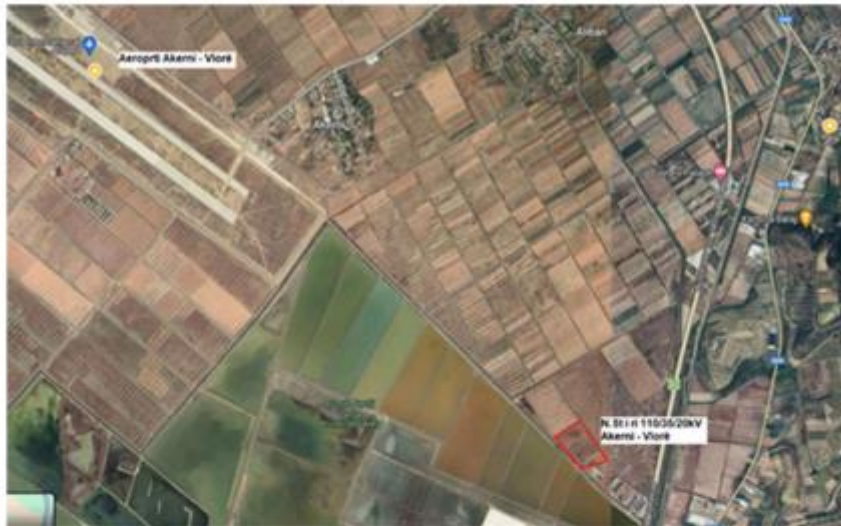
Figure 1 Planimetri e vendosjes së Nenstacionit të ri dhe Aeroporti i Vlores