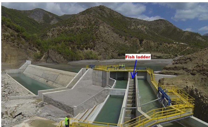
Foto , Shembull e kalimit te peshqve tek vepra e marrjes

Kalimi i Peshqve eshte parashikuar te behet sipas standardeve europiane, ku eshte respektuar menyra e levizjes se peshqve dhe gjithashtu eshte bere ne respektim te ndikimit pamor ne mjedis. Stafi ka verejtur se tipi i perzgjedhur per "fish passage" dhe zbatimi ne objekt I tij eshte ne perputhje te plote me normat dhe kerkesat mjedisore per objekte te tilla. Ne vepren e marrjes do te ndertohet "fish ladder" me beton per nje distance te shkurter ,e cila mendojme se eshte zgjidhje e mjaftueshme ne kete rast dhe me pas me ane te nje "rock ramp – bypass fishway" kalon ne rrjedhen normale ne lumit.