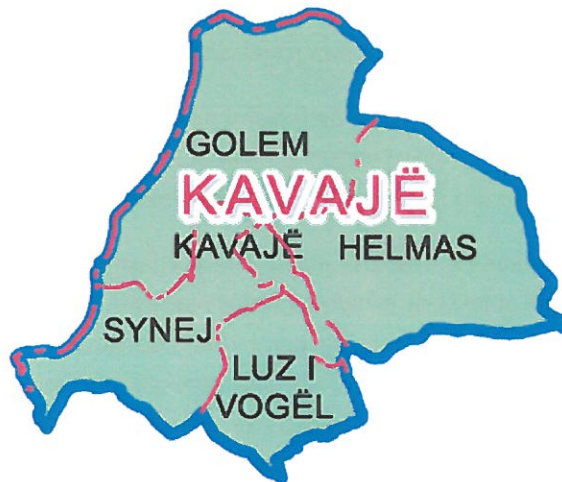
Harta e ndarjes Administrative të Bashkisë Kavajë

Popullsia: Sipas Censurit të vitit 2011 Kavaja numëron një popullsi prej 40,094 banorësh, ndërkohë që sipas Regjistrimit Civil kjo bashki numëron 79,445 banorë. Me sipërfaqe prej 198.81 km 2 , ajo ka densitet prej 201 banorë/km 2 sipas censurit dhe 400 banorë/km 2 sipas regjistrimit civil.