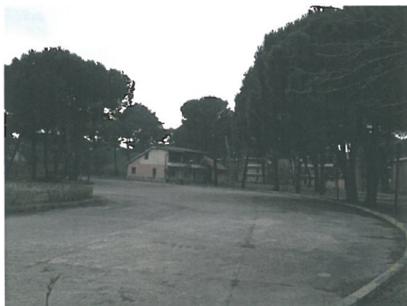
Foto te gjendjes ekzistuese te kompleksit ekzistues

Brenda ambienteve te kompleksit pushuesit do mund te gjejne ambiente sportive dhe relxi, nderkohe aquaparku do ofroje ghithe lojrat e ujit per stinen e nxehte. Hotelet do kene ne perberje te tyre dhe sauna dhe spa si edhe qendra masazhi te cilat do jene funksionale edhe ne periudhen e dimrit duke e bere kompleksin te frekuentueshem gjate gjithe vitit