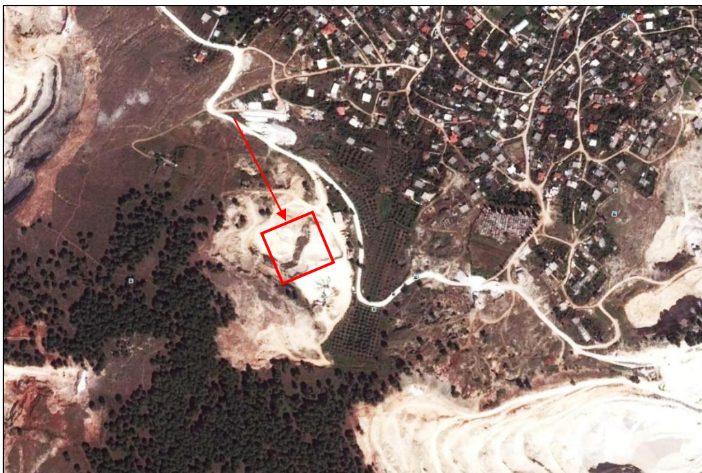
Fig.1 - Harta e vendodhjes së objektit përkundrejt rajonit